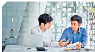
香港電訊為不同行業客戶提供符合其特定需求的支援服務。

香港電訊多年來致力為中大型企業提供一站式企業管理服務，其專業工程團隊擁有多種專業領域知識，能夠一次解決各種技術問題，節省客戶的寶貴時間，今年更榮獲《信報財經新聞》頒發「顯卓企業託管服務大獎」以肯定其不斷創新的企業管理服務。香港電訊具備豐富行業經驗，熟悉不同行業的獨特需求。不論是銀行、保險、證券、零售餐飲以至學校，香港電訊都能為各行業提供度身訂做的支援服務，滿足客戶指定的服務承諾及指標。例如保險公司需要支援眾多