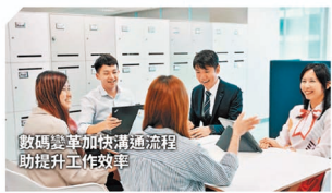
數碼變革加快溝通流程 助提升工作效率