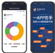
凱基亞洲手機應用程式 KGI Asia Power Trader 提供卓越的財富管理和投資功能。