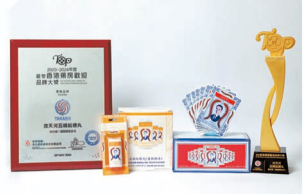
沈天河五蜈蚣標丸