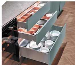
屋主可根據自己的喜好訂造尺寸，令櫃體及拉直，整體擁有自己的獨特風格。