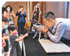
「貓之達人分享會」邀請俄羅斯藍貓專家分享飼養心得，住戶亦可近距離接觸貓貓。