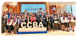
建行(亞洲)成功舉辦「建設未來銀行家」商校合作系列活動，並邀請了師生蒞臨九龍灣建設銀行中心進行交流。

建行(亞洲)成功開拓中小企業線上開戶業務，2023年總開立新戶口按年增200%，線上開戶客戶佔比約七成，提供數碼企業銀行服務方案；推出綜合性收付款管理平台「收付通」，助力工商商戶以一站式電子化收付款功能提升營運