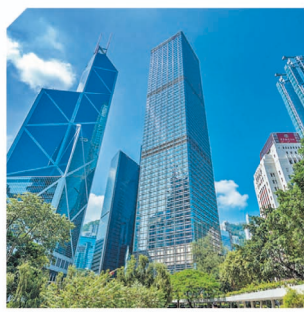
長江集團中心屹立于中環核心地段，為長江集團總部的所在地，亦為長實的旗艦投資物業。