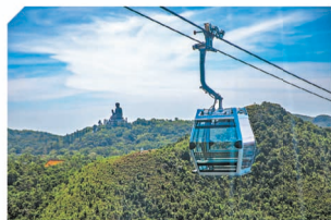
全景纜車大受歡迎，昂坪 360 投資逾千萬元增購 10 部全景纜車，冀於年內投入運作。

今年首四個月，纜車所帶動的人均消費按年兩成七，較 2018 年增加三成二；昂坪市集人均消費亦錄得升幅。客量分布方面，內地、澳門及亞洲市場表現強勁，整體恢復狀態令人滿意。因應需求上升，昂坪 360 已在法國訂購全新 10 部全景纜車，料今年第四季陸續到港並逐步投入服務。