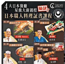
煤氣烹飪中心憑藉本地地產商會及日本料理協會的鼎力支持，更獲由四大日本企業及日本料理協會聯合頒發的「日本職人料理證書課程」。

星級酒店實習，親自體驗星級廚師的日常運作及與名廚交流。只要學員修畢課程及通過考試，就可獲法國政府頒發的「法國廚藝訓練證書」。自課程開辦以來，已吸引不少城中名人及專業人士報名，反應非常熱烈。