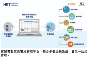
智慧電動車充電站管理平台，整合多個企業系統，實現一站式管理。