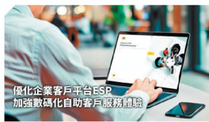
優化企業客戶平台 ESP 加強數碼化自助客戶服務體驗