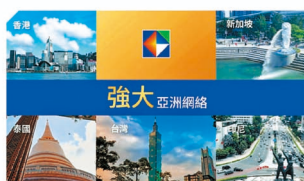
凱基證券擁有強大的亞洲網絡，覆蓋地區包括台灣、香港、新加坡、印尼及泰國。