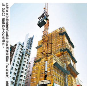
位於東京街的里維士自置全港首個採用創新「組裝合成」建築

雖然華懋並非上市公司，唯集團深明公開資訊和透明度的重要性，遂從 2019 年起，每年發表可持續發展報告，至今已出版了四期。報告詳細闡述華懋，包括物業服務團隊和如心酒店集團在可持續發展方面的承諾、管理方針及績效，確保集團所作出的每項決定都對環境和社會負責。