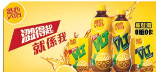
維他奶多年來堅持創新，由單一豆奶類產品發展到現在營養美味的多元化產品，如近期的熱賣產品維他奶™ 0 糖檸檬茶。

維他奶認為物料的循環再用對環境帶來正面的影響，致力減少將生產過程中產生的廢物送往堆填區，推動循環經濟。公司的目標是在 2025/26 財政年度，由生產過程中產生的豆渣回收率為 99%，而目前豆渣回收率已達 98%。