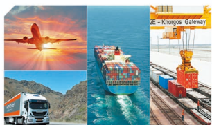
集團在環球海運面臨挑戰時，為客戶提供貫通歐亞的創新貨運替代解決方案，以減省交付時間和成本。