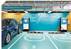
The Point 推出全港首創的「積分兌換充電服務」，為電動車車主提供便利。

The Point 一直力求創新，是全港首個大型商場網絡引入全新「即賺分」服務，有最多商戶類型參與計劃，包括食肆、服裝時尚、美容化妝