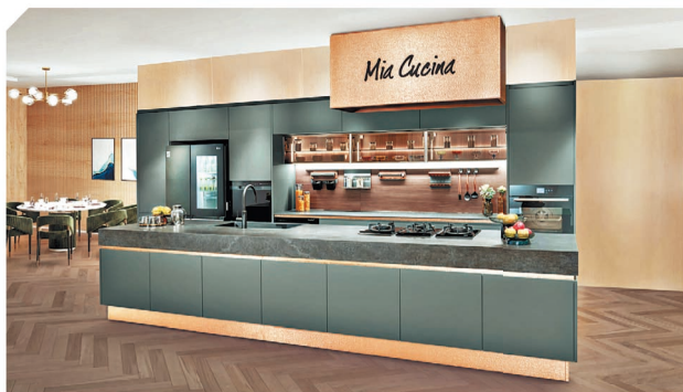
以藝術裝飾和金屬元素為靈感，Mia Cucina 全新廚房混搭不同歐洲進口物料，打造風格獨特的入廚空間。

欖綠色啞光門板為基調，備有抗指紋和可透過熱力修復表面刮痕的特性，同時具有抗紫外線的功能，能保持廚房色澤歷久彌新。Mia Cucina 設計團隊更精選 Dekton 耐刮耐磨的密瓷岩板作枱面，石材夾雜著淺灰色紋理，為廚房增添型格氛圍，實用與美觀兼備。此外，廚櫃邊緣位置注入獨特火山岩紋理的玫瑰金銅片，營造型格感，層次更為豐富。