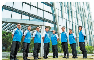
豐盛生活服務旗下三大業務均擁有龐大的專業團隊，以豐富經驗、專業技術及優質服務，為集團建立卓越品牌。