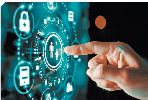
AI時代來臨為各行各業帶來正面影響，香港電訊推出的數碼方案具備AI功能。

計劃自本年三月起開放予餐飲業中小企客戶申請，採用電子支付系統及店面銷售，目的是協助餐飲業自動化收款和結算的工作流程，並支援電子支付以開拓新收款渠道。香港電訊智能POS，一機支援16個電子支付平台，令交易結算更快更準，另設店面銷售包括自助式店面銷售方案，如自助落單系統和自助售賣機等。系統更可提供營銷數據報表，讓企業分析其業務狀況，為業務決策提供依據。