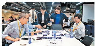
舉辦人工智能攻防「卡牌會」，幫助企業提升安全意識及制定出一套完整的安全策略。

網絡安全解決方案升級至TrustCSI™ 3.0雲網神盾，利用「AI攻防」實踐及「人工智能」兩個核心概念，重新定義信息安全，運用AI的優勢將安全態勢由被動變為主動出擊。