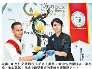
法國 IDE 烹飪文憑頒發予不少名人學員，當中包括梁朝偉、梁祖堯、劉心悠等，是城中最受歡迎的烹飪文憑課程之一。