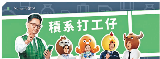
宏利MPF在投資者教育方面亦不遺餘力，今年夥拍攝影家推出最新《積系打工仔》強積金短片系列，希望藉此提高不同年齡打工仔對積極管理強積金的關注度。