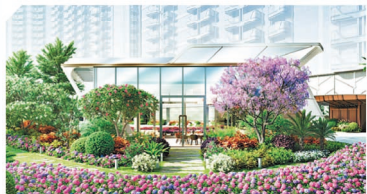
「啟德海灣」園林逾 9.8 萬平方米，以「GARDEN IN THE CITY」為設計概念。