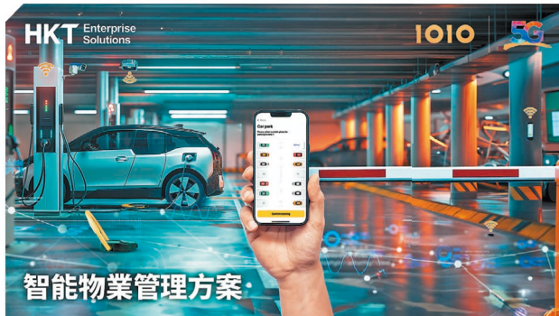
HKT Enterprise Solutions | 1010 利用 5G IoT 技術實現互聯停車場的概念，並開發一站式智慧 IoT 及電動車充電管理平台。

HKT Enterprise Solutions | 1010 全面的智慧停車場管理方案，透過 5G IoT 技術將電動車充電站連接到自家開發的 IoT 智慧管理平台，實時偵測充電站的使用狀況，並根據充電車位的預訂情況，以互聯停車鎖自動鎖及解鎖車位。當遇到不當使用充電車位的情況時，平台更會發出實時提醒，讓物業管理人員可及時遠距處理，無需花費人手定時到現場檢查使用情況，為物業管理人員優化充電車位的使用之餘，更可減省不必要的人手運作，提升停車場的營運效率。除了遠距充電車位監測及管理外，IoT 智慧管理平台更透過 API 整合多個不同開發商提供的系統。物業管理人員可在同一個儀表板上集中瀏覽不同的數據，以及統一管理計費、支付、保養，及保安等系統，簡化物業管理流程。