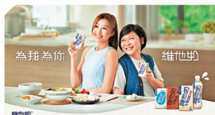
去年起，維他奶推出全新品牌企劃「為我 為你 維他奶」，展現對大眾的關懷和支持。

與此同時，維他奶一直積極尋求突破，繼早前推出全港首創的新鮮茶自動售賣機，為無添加防腐劑新鮮茶開拓靈活銷售渠道外，近期亦與不同合作夥伴拓展創新的經營策略，包括與連鎖咖啡店及快餐店合作推出「維他奶™ 山水™