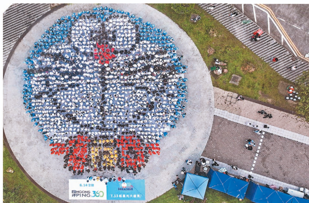
360 義工隊聯同近 1,500 名小學生及師範輔導會義工，昂坪市集列隊砌出多啦 A 夢圖案。

統，賓客於指定平台購票，即憑二維碼入閘，減少輪候時間。營銷團隊亦針對不同市場賓客作策略部署，於國內各大主要電商平台推出優惠套票，吸引來自不同省份的遊客。