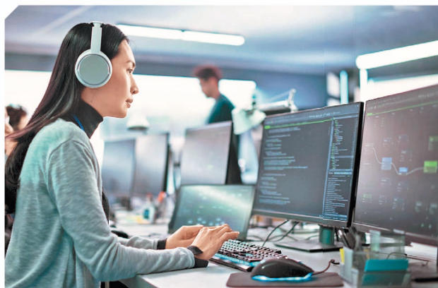
借助 EMS 全面的 IT 技術支援，香港企業能夠有效控制成本以解決 IT 人才短缺問題。

作為香港領先的企業管理服務供應商，香港電訊深知客戶在支援內地業務時所面對的挑戰。