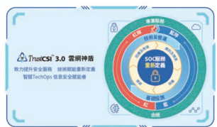
將網絡安全注入了人工智能及最新技術，在「識別及預測」、「保護」、「偵測」、「回應與恢復」四大環節築起網絡安全框架，透過TrustCSI™ 3.0雲網神盾技術重新定義企業防護。

「AI攻防」實踐，顧名思義會有「攻守兩方(紅藍隊)」，幫助企業進行四個階段的網絡攻擊測試，全面評估自身網絡防禦能力——安全專家會先借助AI偵測企業現有IT資產架構有否存在漏洞，第二階段便會幫助企業修補漏洞，之後再正式開展「紅藍攻防」對企業營運環境和系統的攻擊及防禦能力進行全面的「壓力測試」，最後階段會再針對問題進一步改善。