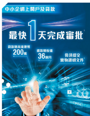
上商提供新新方便的融資途徑，推出中小企網上銀行開戶平台，客戶最快只需20分鐘便可完成開戶申請及最快於1天內可成功開立戶口。

上商與客戶保持長遠緊密的合作關係，深入了解每位客戶的切身需要，提供「度身訂造」的融資及理財方案，是企業的最佳業務拍檔，多年來見證了不少中小企業的發展。