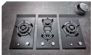
明火煮食可滿足任何烹飪需要。TGC組合式煮食爐系列可調較不同程度的火力，並可連接智能控制器，締造更便捷的明火入廚體驗。

Mia Cucina 於北角陳列室隆重推出全新檯檯綠色廚房，設計師巧妙地運用藝術裝飾 (Art Deco) 時代大膽用色和金屬元素，配襯意大利進