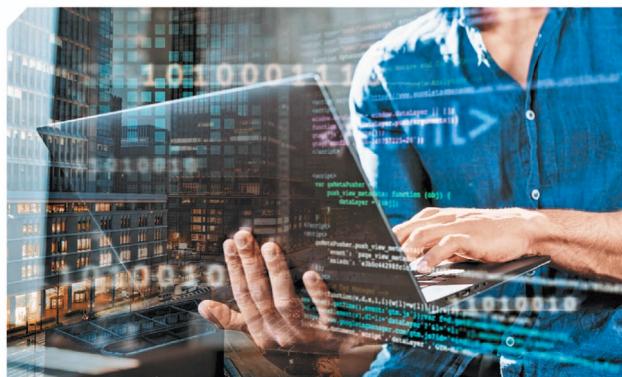
香港電訊為全港首家以 50G PON 技術支援 50G 應用的電訊服務供應商。