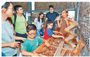
華懋集團早前推出 REACT 同行全民減廢活動系列，透過在社區開展一連串以減廢減廢、升級再造、資源回收等環保主題的活動，鼓勵各年齡層一同行動，親身體驗交流，從中獲得實用知識，再積極為實際減廢行動。圖為市民透過集團旗下會員平台「知心羣」報名參加「PARK 專業團」了解廢物回收再循環的知識。

為實現減碳目標，華懋推出了一系列措施。除了逐步在旗下物業安裝可再生能源系統，亦積極響應特區政府的《香港電動車普及化路線圖》，增加使用電動車以及在旗下物業停車場提供更多電動車充電器，以實際行動支持綠色運輸及環保出行。