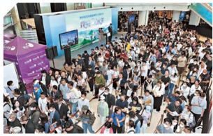
長實推出位於黃竹坑站上蓋 Blue Coast，創 8 日累計售出逾 540 伙，總值逾 100 億元之銷售成績。