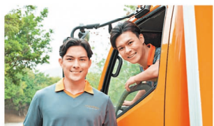
嘉里物流聯網以亞洲為基地，擁有高度多元化業務及強大亞洲網絡覆蓋的國際第三方物流服務供應商。